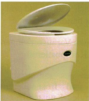
Die TOA Maxi/Sanita, weiß o. granitfarben

BERGER BIOTECHNIK® GmbH Bogenstraße 17 D - 20144 Hamburg Tel.: (040) 439 78 75 Fax: (040) 43 78 48 eMail: info@berger-biotechnik.de Internet: www.berger-biotechnik.de