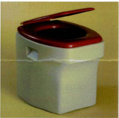
Die TOA Mini